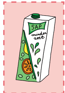
Sap minder zoet