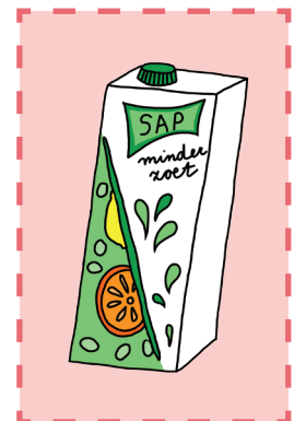
Sap minder zoet

Aantal suikerklontjes per glas (200 ml): 3